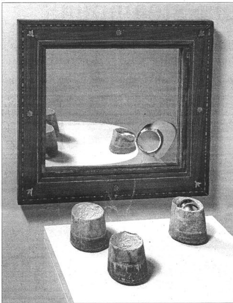
'Intercanvi I', una de las obras de Jordi Alcaraz incluida en la muestra.

Así, en su obra, son los pigmentos, las líneas, la superficie, el volumen, lo externo y lo interno, o la representación, los protagonistas de su discurso: pasta coloreada como material primigenio; charcos de pintura retenida o el rastro que alude a su fluidez; trazos que se escapan de los límites; líneas que son de