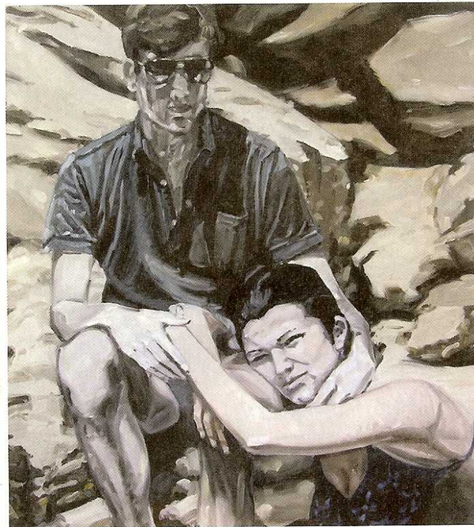
Novembre, 2006. Fotografia original i pintura de 81 x 73 cm